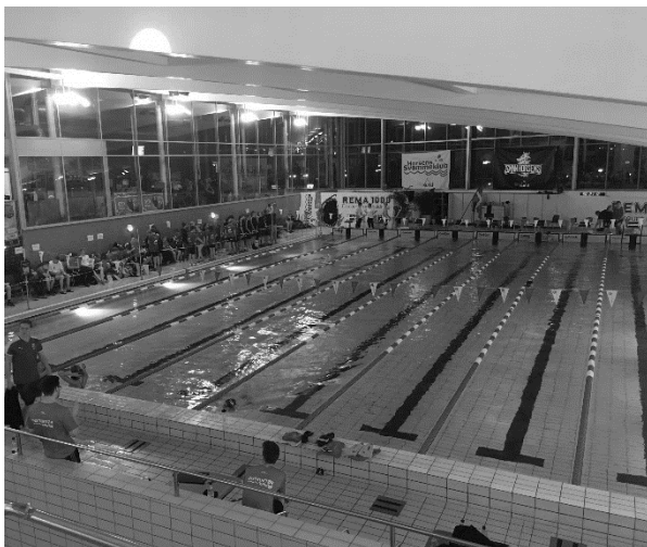
Vest Kortbanemesterskaber 2017 i Horsens

Vi har i 2017 afholdt større og mere succesfulde stævner end nogensinde før, heriblandt REMA 1000 CUP (tidligere Forum Horsens Cup) samt Vest Kortbanemesterskaber. Begge stævner blev både ledet og afviklet af toprutinerede projektgrupper og den bedste hjælperstyrke en klub kan ønske sig. Vi er blevet kendt af andre klubber og unionen for vores usædvanlige høje kvalitet og præcise eksekvering. Sammen med bl.a. AquaCamp er aktiviteterne en også betydelig indtægtskilde for klubben.