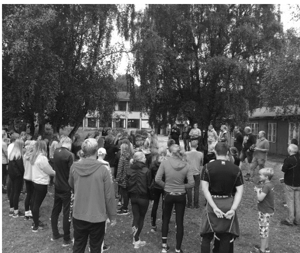
Rystesammentur på Himmerlandsgården

Jeg håber mit beskedne opråb, bringer mere frivillig hjælp ind i klubben i 2018 – det er jo vores egne børn og deres svømmekammerater vi hjælper.