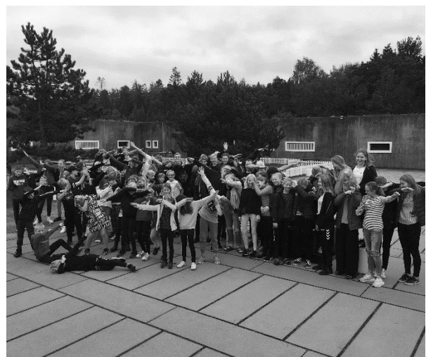
Uge 42 træningslejr i Ebeltoft

Vigtigt at nævne er også vores klublokale i Forum Horsens, der er omdrejningspunkt og mødested for mange aktiviteter og svømmere. Klublokalet udgør kontor, værested og mødested for både svømmere, medarbejdere, udvalg og bestyrelsen. Personligt vælger jeg ofte, at lave mit bestyrelsesarbejde i klublokalet for at få et strejf af stemningen, mærke energien og ikke mindst hilse på vores dygtige svømmere – et godt håndtryk giver godt humør. Det er også her konkurrencesvømmerne, efter morgentræningen, starter lørdagen med Nutella og friske rundstykker fra Den Lille Bager - et godt initiativ.