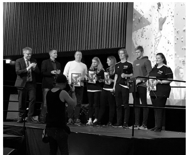
Overrækkelse ved Horsens Idrætspris 2017

Vi fik også Horsens Kommunes Handicappris samt blev nomineret til Årets Klub og Årets Årgangs- og Junior Træner i Danmark. Alt sammen er fantastiske anerkendelser af den konstante indsats vores svømmere og trænere har leveret gennem hele året, 2017.