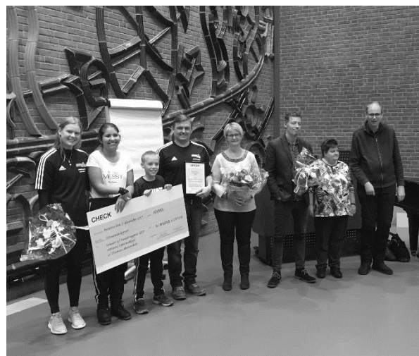
Overrækkelse af Horsens Kommune Handicappris

Efter Horsens Svømmeklub indgik aftale med Dansk Handicapidrætsforbund (DHIF) i starten af 2017, har området udviklet sig med stor hastighed. Vi har svømmere på Para-landsholdet/Talentholdet og har allerede opstillet ved bl.a. Nordiske Mesterskaber og senest Malmø Open. Vores klub har vundet officielle priser for vores indsats efterfulgt af både foredrag for Kommunen samt interview på DR P4. Det der gør vores koncept anderledes end så mange andre klubbers para-sportsafdelinger er, at vi opfatter alle som en del af bredden og det sociale. Derfor træner og opstiller en del af para-svømmerne sammen med de øvrige konkurrencesvømmere - og det fungerer fantastisk for alle.