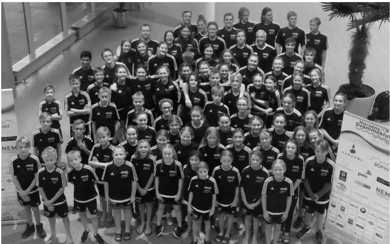
Vores konkurrencesvømmere til REMA 1000 CUP