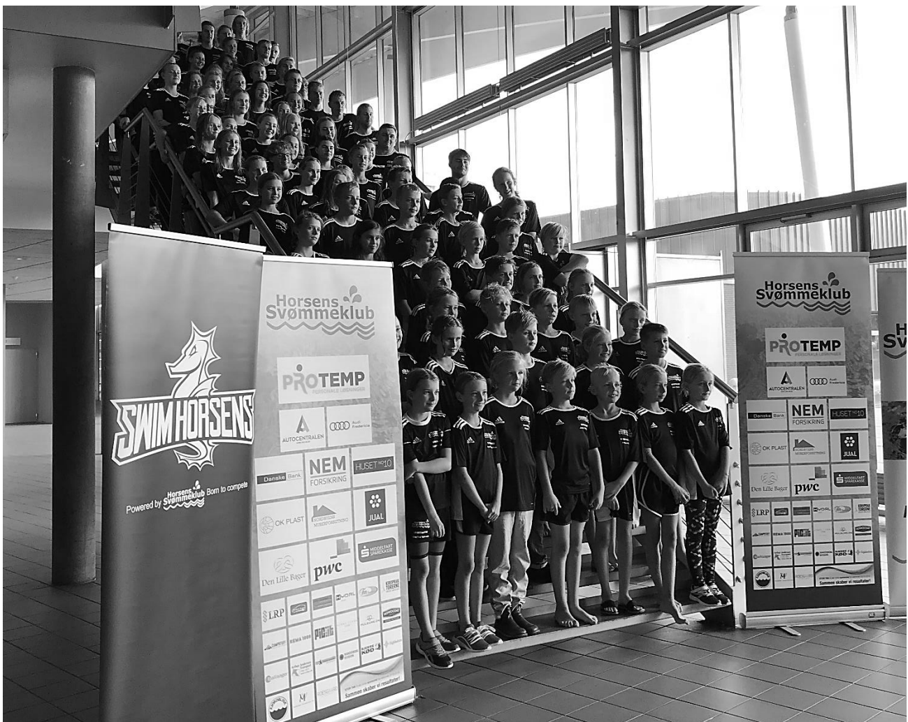
Vores konkurrencesvømmere til REMA 1000 CUP