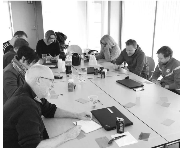
Strategiarbejde med alle fuldtidsansatte og bestyrelsen.

Et stærkt og dedikeret hold af engagerede trænere har ført os flot igennem hele 2018, i både undervisningsafdelingen og konkurrenceafdelingen.