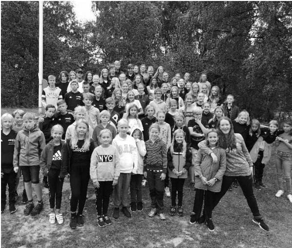
Konkurrenceafdelingen på sæsonens rystesammentur 2018.