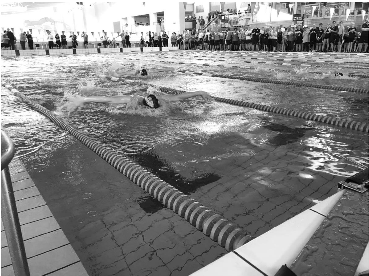
Konkurrencesvømmere til REMA 1000 CUP